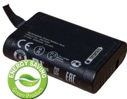
Outil sur batterie