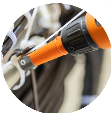
Tête fine et rotative

Collier : de 4.8 à 7.6 mm (0.18 - 0.30 in)