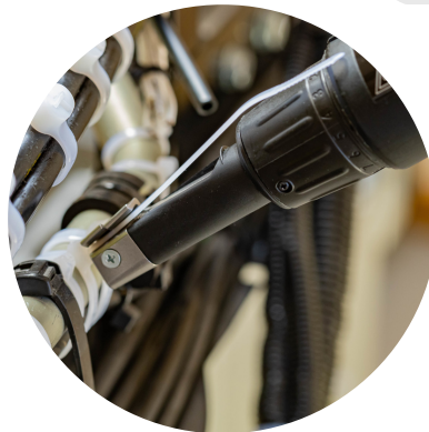
Tête fine et rotative

Collier : de 2.4 à 4.8 mm (0.09 - 0.18 in)