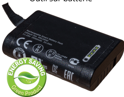
Outil sur batterie